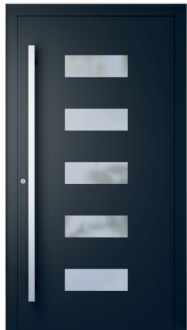
ME 011 S. 2.19