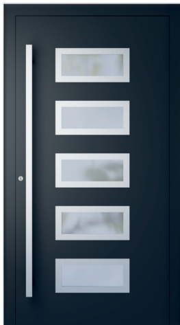
ME 011NX S. 2.21