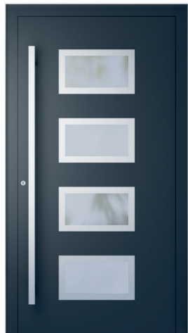
ME 211NX S. 2.21