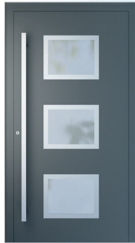
ME 021NX S. 2.21