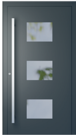
ME 021 S. 2.17