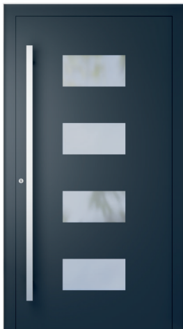
ME 211 S. 2.20