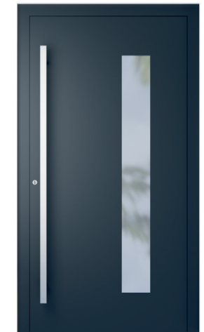
ME 004 S. 2.19