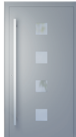
ME 003 S. 2.18