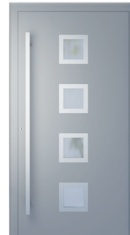
ME 003NX S. 2.20